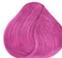
ROSA REBELDE PASTEL Pastel Rebel Pink