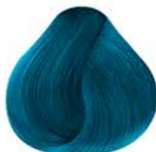
AZUL MÁGICO Magic Blue

The swatch shows the level of lightening required to achieve the shades shown in the color chart. The result may vary depending on the level of lightening achieved and the porosity of the hair.