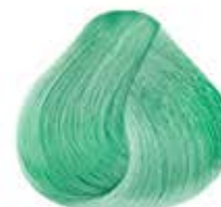
ESMERALDA PASTEL Pastel Emerald