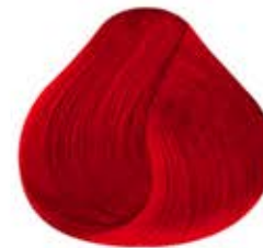
ROJO ATÓMICO Atomic Red