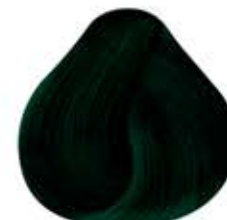
VERDE ENVIDIA Envy Green