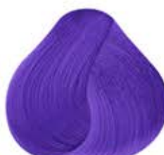
Pastel LILA Lilac