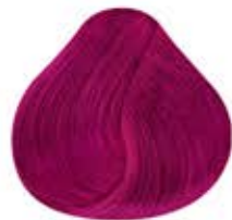
ROJO RUBÍ PASTEL Pastel Ruby Red