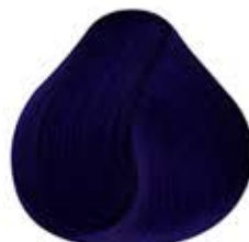
AZUL ELÉCTRICO Electric Blue