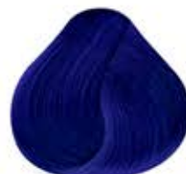
AZUL ELÉCTRICO PASTEL Pastel Electric Blue