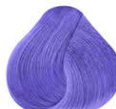
Pastel MORA AZUL Blueberry