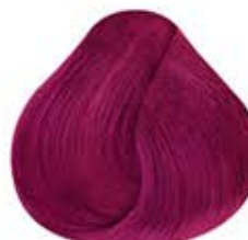
ROSA REBELDE Rebel Pink