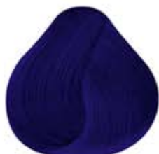
AZUL PROFUNDO Deep Blue