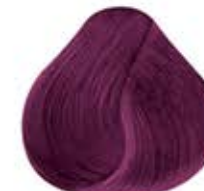
UVA PASTEL Pastel Grape