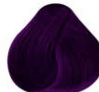
PÚRPURA PASTEL Pastel Purple