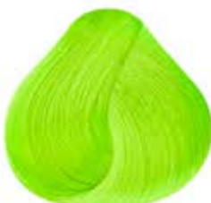
NEON KIWI Kiwi