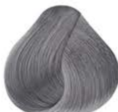
Pastel GRIS POLAR Polar Gray

Pastel COLLECTION LISTOS PARA APLICARSE READY TO APPLY