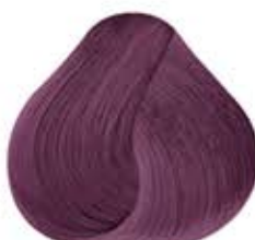
Pastel ROSA ÓPALO Opal