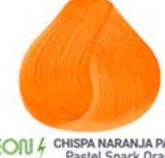
NEON CHISPA NARANJA PASTEL Pastel Spark Orange