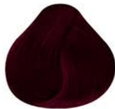
ROJO RUBÍ Ruby Red