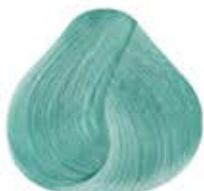
AZUL MÁGICO PASTEL Pastel Magic Blue