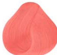
ROSA Candy Pink