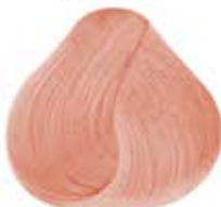
ROSA PASTEL Pastel Candy Pink