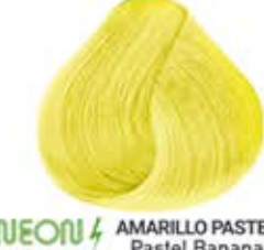
NEON AMARILLO PASTEL Pastel Banana