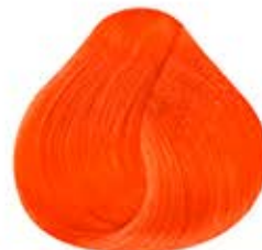
NEON CHISPA NARANJA Spark Orange