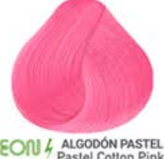
NEON ALGODÓN PASTEL Pastel Cotton Pink