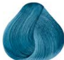
AZUL PROFUNDO PASTEL Pastel Deep Blue