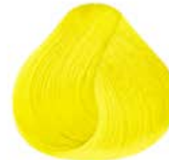
NEON AMARILLO Banana