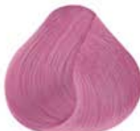
CONFETTI PASTEL Pastel Confetti