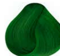
VERDE ENVIDIA PASTEL Pastel Envy Green