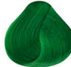
NEON VERDE Lizard