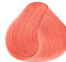
ROJO ATÓMICO PASTEL Pastel Atomic Red