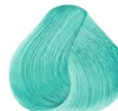
Pastel MENTA Mint