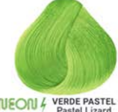
NEON VERDE PASTEL Pastel Lizard