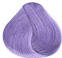
VIOLETA ELÉCTRICO PASTEL Pastel Electric Violet