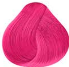
NEON ALGODÓN Cotton Pink

COLORES NEÓN BRILLAN CON LUZ NEGRA (ULTRAVIOLETA) NEON COLORS UV LIGHT REACTIVE