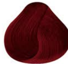
ROJO SANGRE Bloody Red