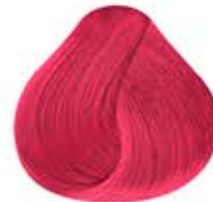
ROJO SANGRE PASTEL Pastel Bloody Red