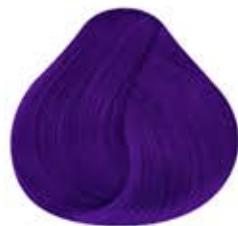
VIOLETA ELÉCTRICO Electric Violet